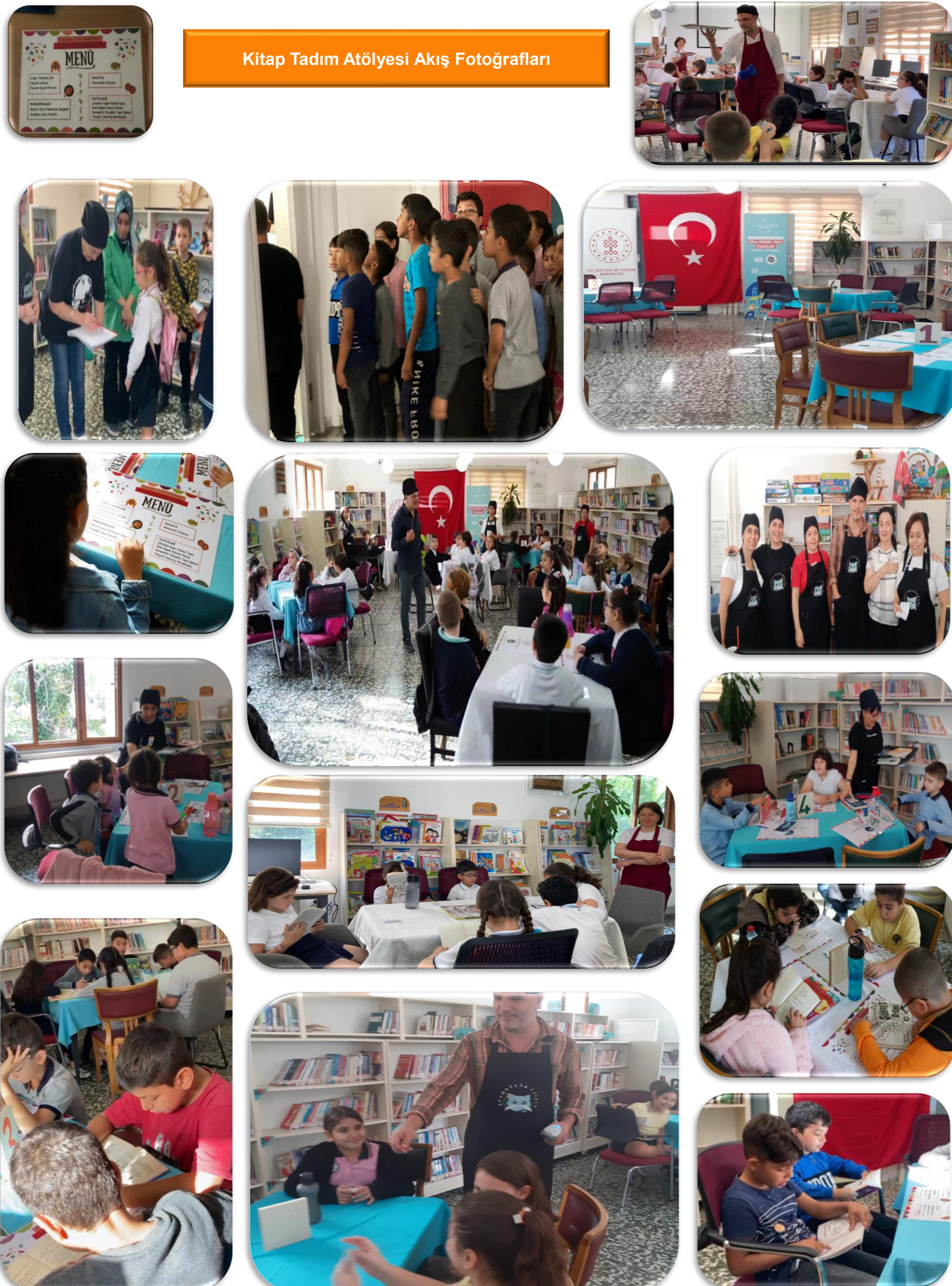
Kitap Tadım Atölyesi Akış Fotoğrafları

KTA , okul çağı çocukları için okuma alışkanlığı / farkındalığı oluşması, okuma deneyimlerinde kütüphanenin yer alması, şimdi ve gelecekte kütüphaneyle bağ oluşturması üzerine kurgulanmıştır. KTA' de kütüphane ziyareti yapan okul çağı çocuklarının, kitap okumaktan haz alması, birlikte okuma farkındalığı geliştirmesi, kütüphane ortamını eğlenerek keşfetmesi, oyunla öğrenmesi amacı güdülmüştür.